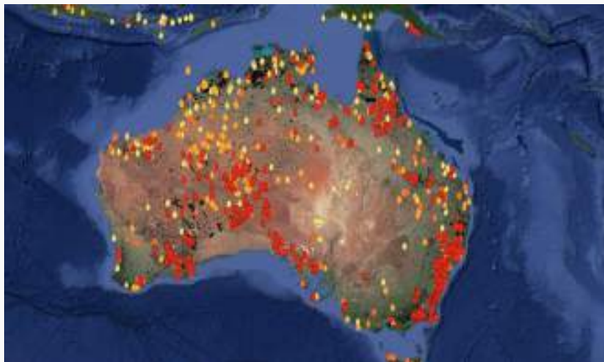
carte des incendies

L'action s'est passée en Australie. Il y a plus de 100 000 personnes évacuées, plus de 2 000 habitations détruites ou endommagées, il y a 500 millions d'animaux tués dont 8 000 koalas et il y a 28 personnes mortes et des dizaines portées disparues. Il y a 3 000 pompiers mobilisés par jour sur le terrain. Scott Morrison avait été sollicité par les habitants. Dès avril 2019 un groupe de pompiers avait demandé de rencontrer le chef du gouvernement Scott Morrison mais celui-ci ne les a jamais reçus.