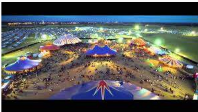
site du festival

Le couvre feu était un festival de musique Rock, Reggae, Ska, Metal et pop rock. Il se déplaçait en Loire atlantique de Migron à Frossay en passant par Retz. Il a été créé en août 1998 par 4 copains punk âgés de 19 à 21 ans. Le public ciblé est les jeunes de 16-30 ans avec un style de musique varié ou les curieux qui souhaite découvrir une nouvelle culture musicale.