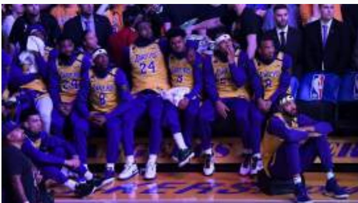
L'équipe des lakers

Les Lakers ont été fondés en 1947, ils sont connus grâce aux nombreux records, notamment avec 15 titres de la NBA et 1 titre BAA (basketball association of America) . Les Lakers sont situés à Los Angeles et se composent de 17 joueurs dont les 5 majeurs qui sont LeBron James, Anthony Davis, Javal McGee, Danny Green et Kentavous caldwell-pope.