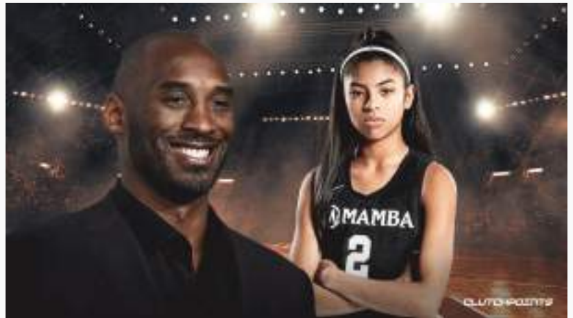
Kobe et sa fille Gianna

En 1996 Kobe Bryant commence sa carrière chez les Lakers à Los Angeles puis la finit en 2016, il y est resté pendant 20 ans. Il a pris sa retraite en 2016. Kobe Bryant et Gianna (sa fille) sont morts le 26 Janvier 2020 dans un accident d'hélicoptère à Calabassas en Californie. Les causes de l'accident sont les mauvaises conditions météorologiques malgré cela le pilote a pris le risque de piloter cet hélicoptère. Une enquête est en cours. C'était un joueur très coté. Nous avons fait les calculs, Kobe Bryant gagnait environ 1,3 millions de dollars par mois.